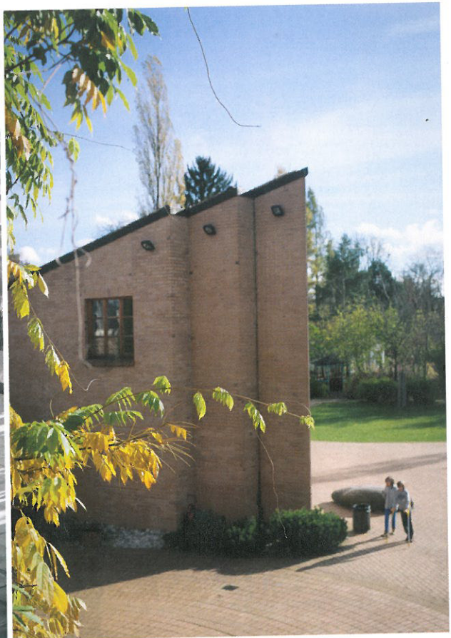
Inklusion? Ein Münchner Gymnasium vereinte Behinderte und Nichtbehinderte schon, als noch niemand diesen Begriff kannte

2009 die UN-Behindertenrechtskonvention. Inklusion heißt zum Beispiel: Alle Kinder und Jugendliche, ob mit Behinderung oder ohne, mit all ihren unterschiedlichen Stärken und Schwächen, sollen gemeinsam lernen.